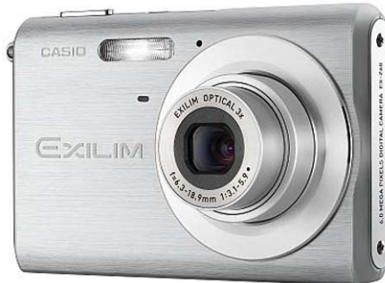
Zu gewinnen! Casio EX-Z60 (6 Mega Pixel)

Ihre E-Mail-Adresse eingeben und schon nehmen Sie an der Verlosung teil.