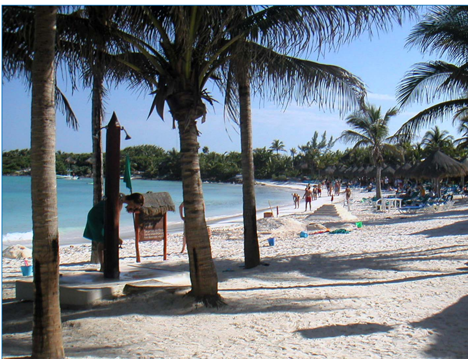
DropFoto.ch wünscht schöne Ferien.