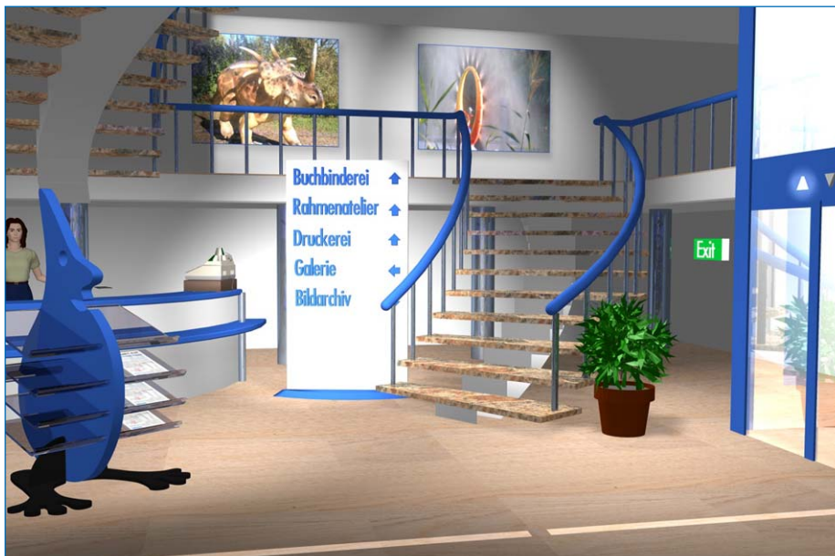
Hier in der Eingangshalle findet die Anmeldung statt. Auf dieser Etage finden Sie auch Galerie.